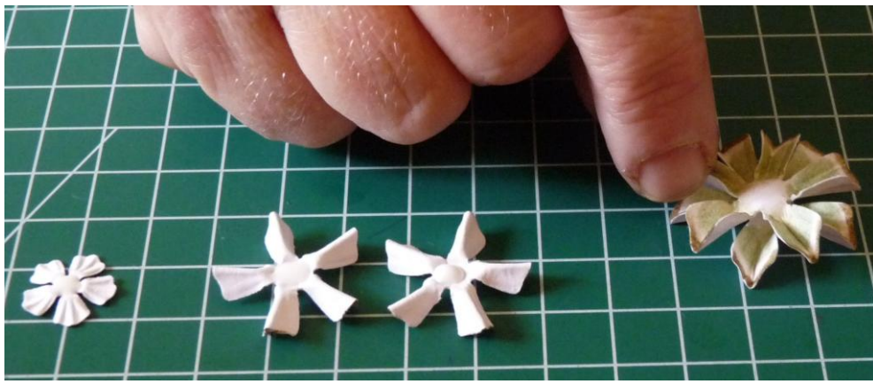
07 Plak de grootste bloem tussen de blaadjes van de begin bloem