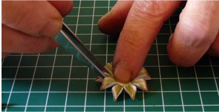
08 Om ze er mooi tussen te krijgen haal je een pincet langs het dubbel gevouwen blaadje.