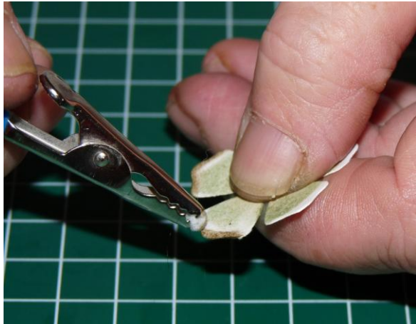
03 Beinkt de randjes van de bloemblaadjes met een 2 e kleur inkt.