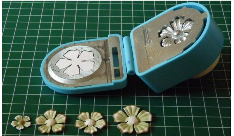
04 Embos ze allemaal