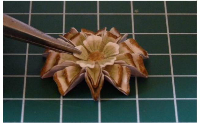
11 en plak als laatste het kleine bloemetje erop.