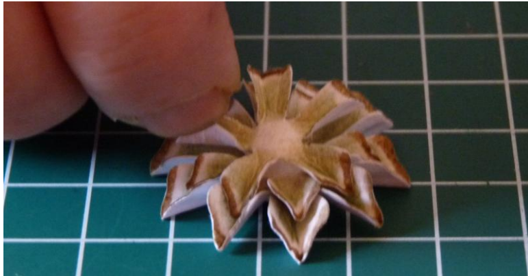
10 Plak de 2 e middelste bloem erop en herhaal het met de pincet