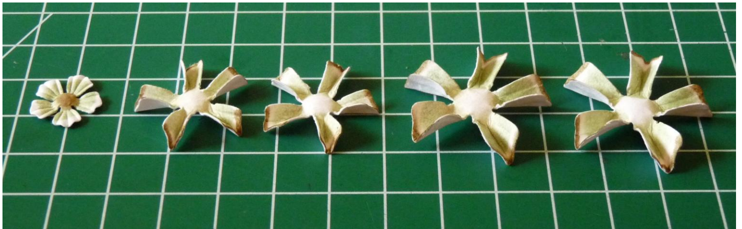
05 Vouw de blaadjes van de 4 grootste bloemen dubbel