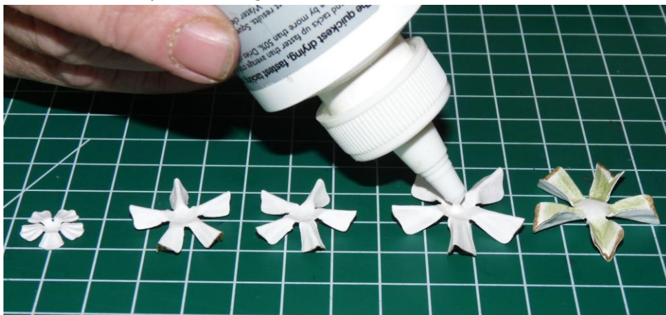
06 Doe op 1 grote, 2 middel en de kleinste bloem een beetje tackyglue