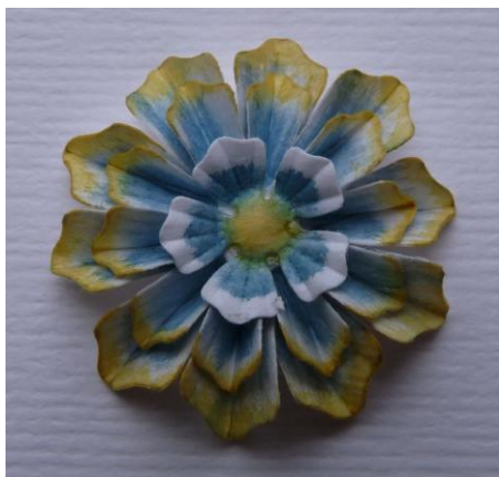
Resultaat ( helaas andere kleur want de foto was mislukt)

Deze uitleg mag uitsluitend gebruikt worden voor particuliere doeleinden en mag niet zonder toestemming ergens anders geplaatst worden!